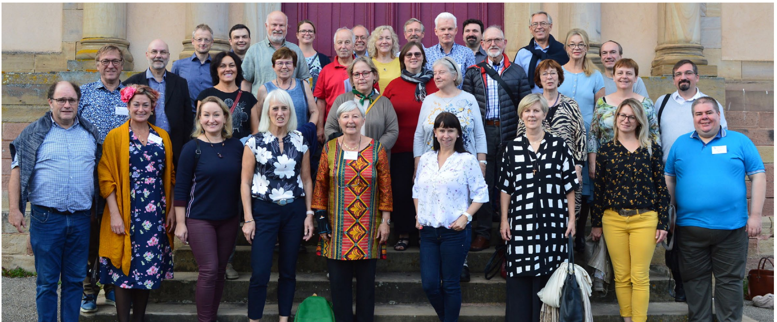
Gruppenbild der Teilnehmer