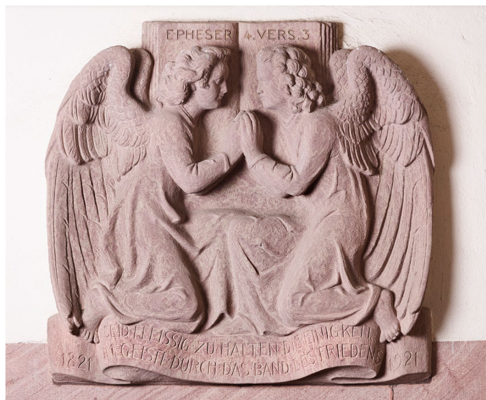
Unionsrelief Christuskirche Karlsruhe

Heute möchte ich Danke Dir sagen für alles Tun in vergangenen Tagen. Und ich wünsche Dir Gottes Segen auf allen Deinen weiteren Wegen!