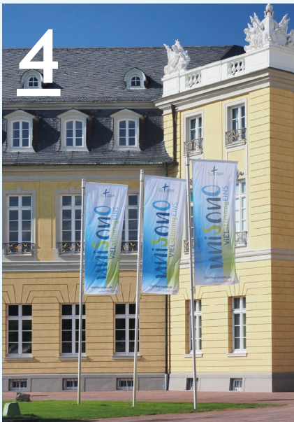
Chorfest in Karlsruhe