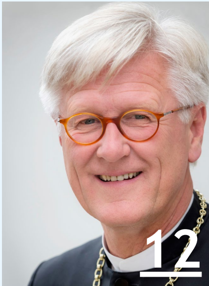
Predigt: Kirchenmusik als Resilienzspender