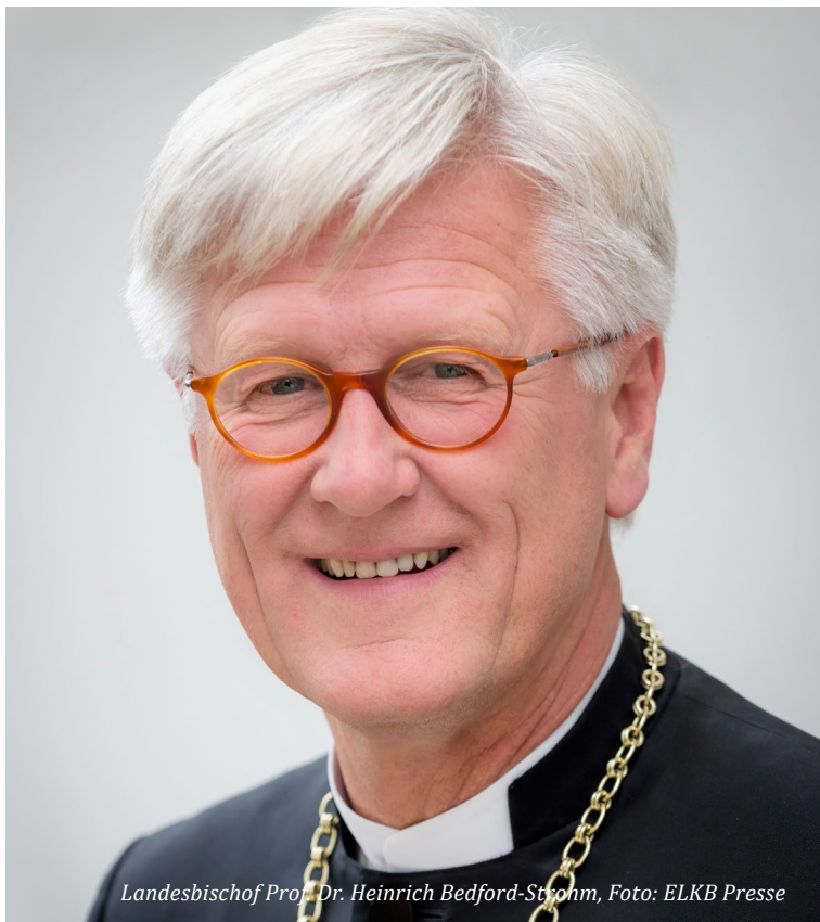
Landesbischof Prof. Dr. Heinrich Bedford-Strohm

Predigt Prof. Dr. Heinrich Bedford-Strohm